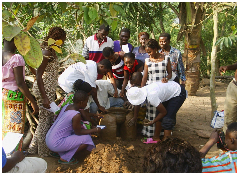
Fabrication par les élèves d'un foyer amélioré.

Favoriser l'émergence d'éco citoyens engagés et responsables, voilà, résumé en quelques mots, la mission que s'est donnée la dynamique équipe de l'ADETOP.