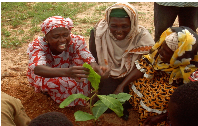
Tout commence par l'ARBRE ...

Epouse du Premier Ministre du Burkina Faso, Présidente de la Fondation Nature & Vie Présidente de l'OI Planèt'ERE naturevie@fasonet.bf