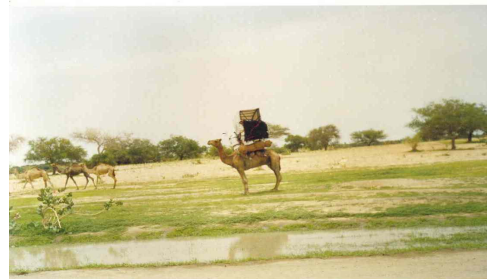
Les pasteurs nomades à la recherche de pâturage dans la région du Lac au Nord Tchad

Conformément aux objectifs poursuivis par l'organisation internationale Planèt'ERE et de ceux du Réseau d'Education Environnementale pour le Développement Durable en Afrique Centrale (REEDDAC), la section de l'Association Jeunesse Anti Clivage de Mao, qui se trouve à 300 km de la capitale Ndjaména, a organisé, au mois de septembre 2006, une semaine de sensibilisation afin de faire prendre conscience aux populations de la menace qui plane sur l'environnement, le but étant de les responsabiliser vis-à-vis de l'environnement. C'est ainsi que des débats, projections de film et jeux-concours ont été organisés en faveur des jeunes.