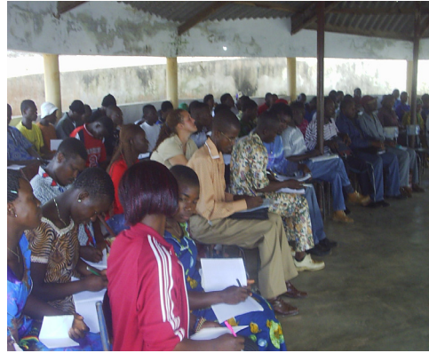
Camp chantier : formation sur l'environnement.

Forte de dix années d'expérience en ERE, l'ADETOP a été créée par des jeunes du Kloto unis par un désir commun : faire partager leur amour pour cette région riche d'une généreuse biodiversité et leur désir de la sauvegarder.