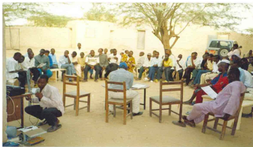
Causerie débat avec les jeunes au Centre de Lecture et d'Animation Culturelle de Mao

Concernant l'éducation environnementale, le projet du Tchad n'a pas rencontré de succès, d'autant plus qu'il ne concerne que la partie sud du pays. La partie nord qui est presque désertique n'en a pas profité. Les rares actions dans le domaine environnemental (ONG et Associations) ne couvrent pas l'ensemble de la partie nord.