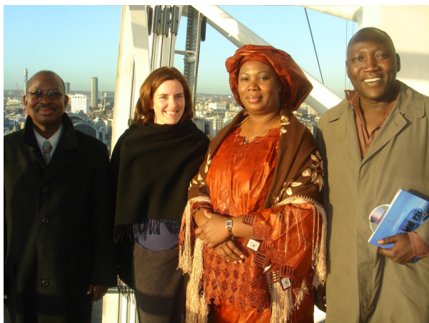
Une équipe : MECV-TREE AID-Fondation Nature & Vie

Au Burkina Faso où TREE AID a établi, en 1998, son bureau sous régional, 20 Projets de gestion des ressources naturelles ont été appuyés par TREE AID en partenariat avec les départements ministériels ainsi que des associations et ONG locales.