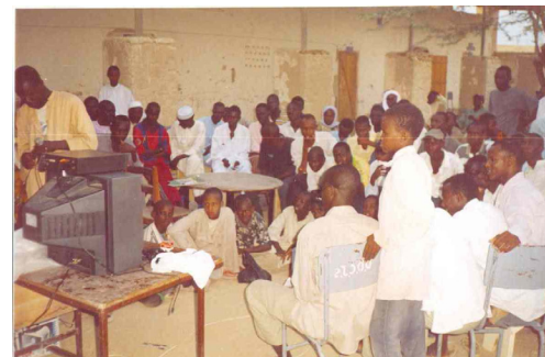
Projection de film sur les coupes abusives de bois

En cette fin d'année qu'il me soit permis, au nom des jeunes de mon Association, de présenter mes meilleurs vœux de santé, de bonheur et de prospérité à toute la famille Planèt'ERE. Que l'année 2007 soit une année de réussite de tous les projets de Planèt'ERE et qu'elle soit aussi une année de paix durable au Tchad.